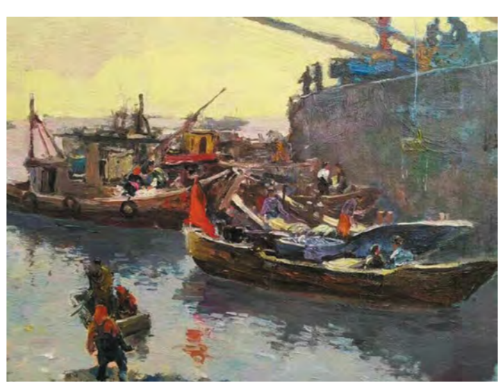
油画 美术与设计学院 吴忠光(教师)